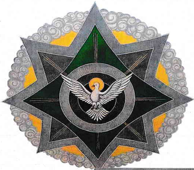
Porumbelul - reprezentare a Duhului Sfânt